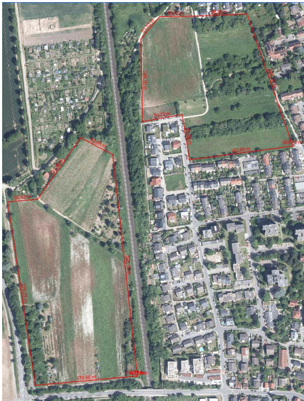
Luftbild der betroffenen Flächen