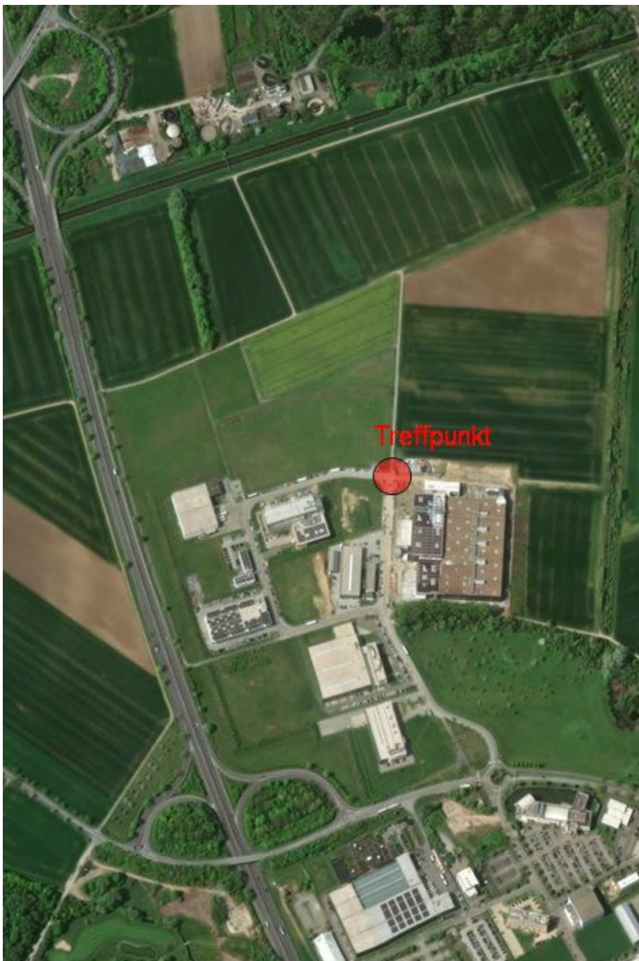
Luftbild Stubenwald II inkl. neue Fläche